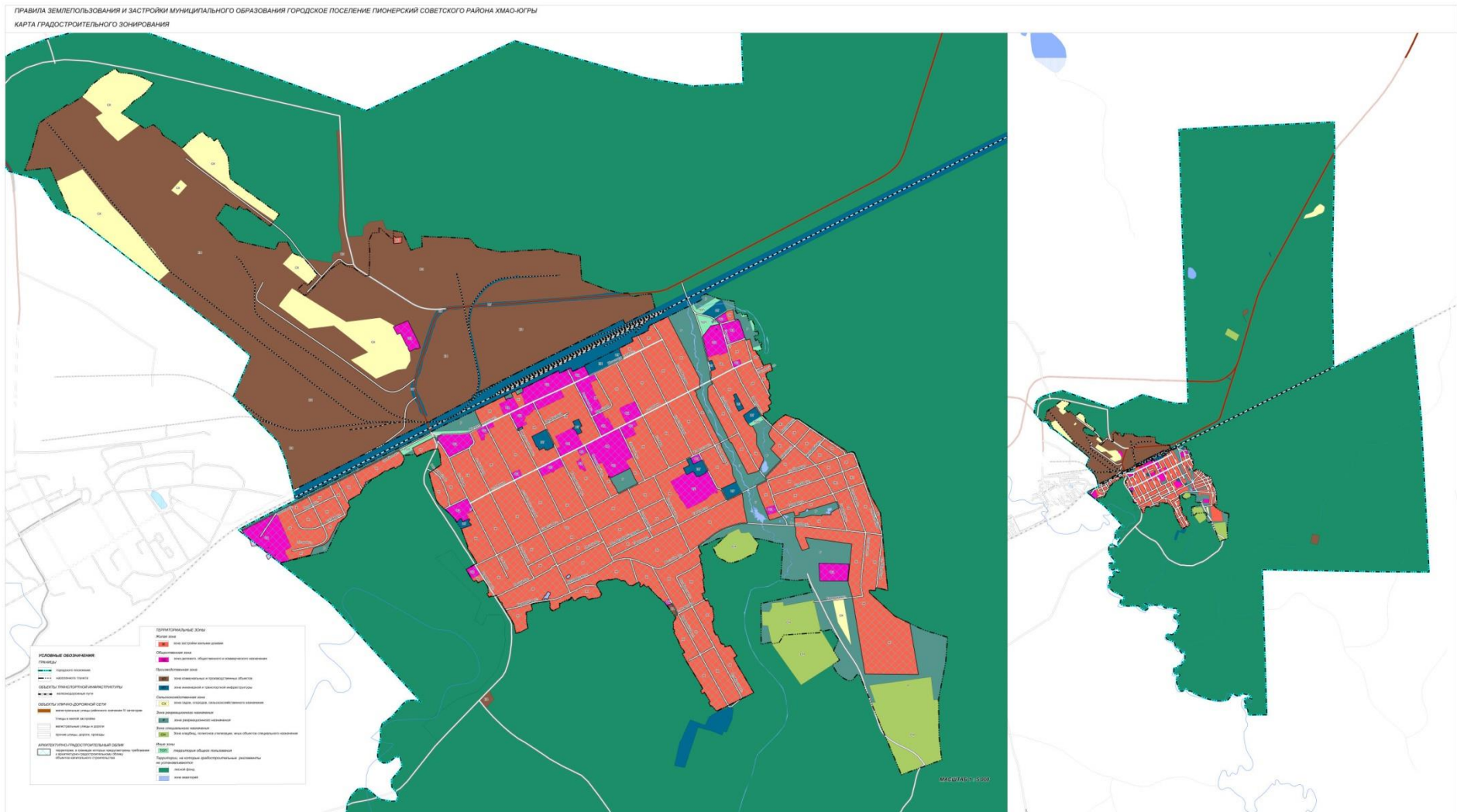
Карта градостроительного зонирования